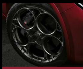
21" kola z lehkých slitin QV Prototipo (3EQ)