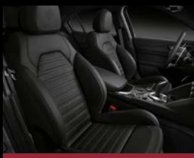
Sportovní kožená sedadla (788) – standard