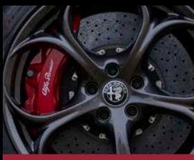
Karbon-keramické brzdy (BRM) *červené lakované třmenů lze objednat i na standardní brzdový systém