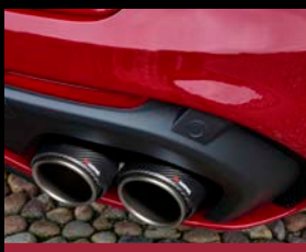
Titanový výfukový systém Akrapovič (NEC)