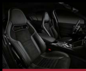
Karbonová sedadla Sparco (60A)