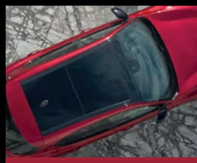
Elektricky ovládané panoramatické střešní okno (400)