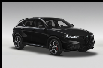
Černá Alfa (6FX-601)