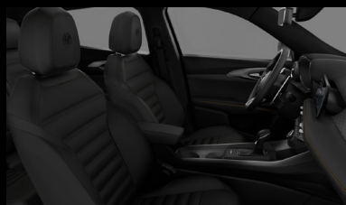
Sedadla v černá perforované kůži (Sprint a Veloce 095)