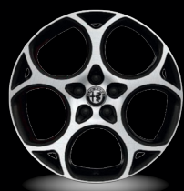
19" disky z lehkých slitin Veloce (Sprint a Veloce 1MJ)