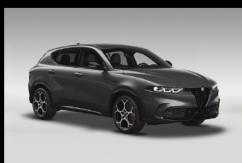
Šedá Vesuvio (3XV-581)