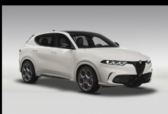
Bílá Alfa + černá střecha (0UX-222) Pouze Tributo Italiano