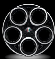
18" disky z lehkých slitin Classico Bi-Colore (Sprint WFL)