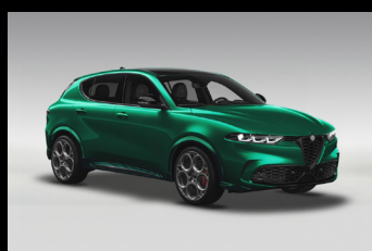
Zelená Montreal + černá střecha (6Y3-041) Pouze Tributo Italiano