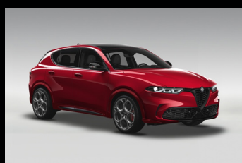
Červená Alfa + černá střecha (6Y2-956) Pouze Tributo Italiano