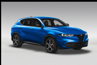
Modrá Misano (3YS-756)