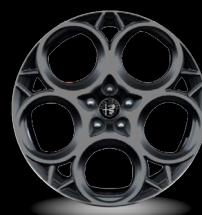
20" disky z lehkých slitin Prototipo (Veloce a Tributo Italiano 1M5)