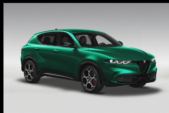
Zelená Montreal (6FW-398)