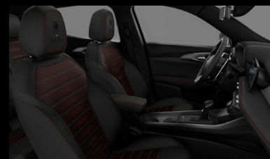
Sedadla v perforované černé kůži s červeným prošíváním a podkresem (Tributo Italiano 508)