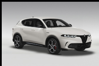
Bílá Alfa (2H6-240)