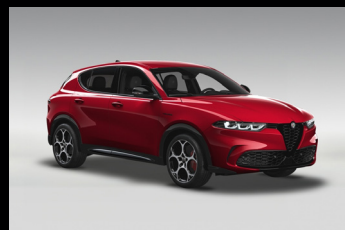
Červená Alfa (1WY-414)