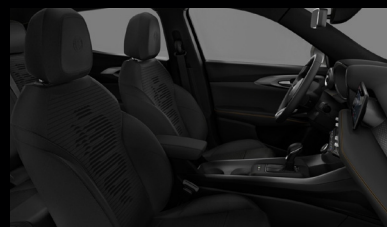
Sedadla v černé látce se znakem Biscione (Sprint 070)