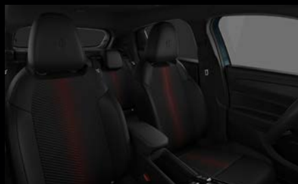
Sedadla Spiga v černočervené látce v kombinaci s těchno kůží (Junior, Speciale a Veloce 070)