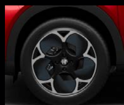
18" disky z lehkých slitin Aero (Junior 2VX)