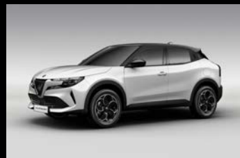
Bílá Sempione + černá střecha (5EZ-934)