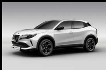
Bílá Sempione (5CA-268)