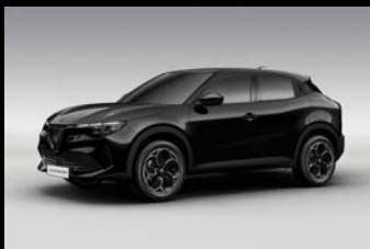
Černá Tortona (5DL-601)