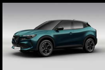
Modrá Navigli + černá střecha (5SH-522)