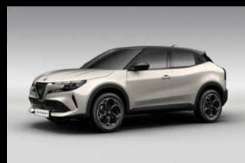
Slonovinová Scala + černá střecha (9LP-640)