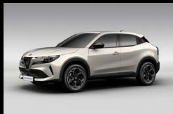
Slonovinová Scala (3YS-636)