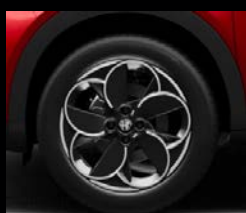
18" disky z lehkých slitin Petali (Junior a Speciale 1M5)