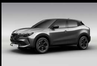
Šedá Arese + černá střecha (5YW-664)