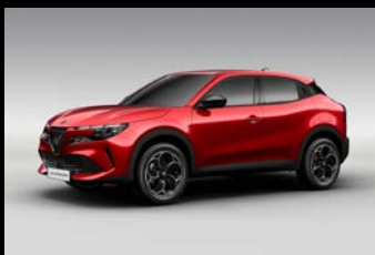
Červená Brera (58Z-136)