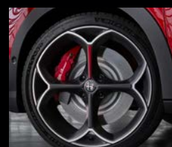
20" disky z lehkých slitin Venti (Veloce 5RK)