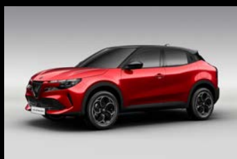
Červená Brera + černá střecha (5SH-522)