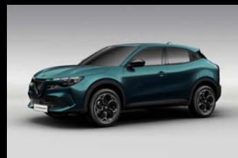
Modrá Navigli (52U-688)