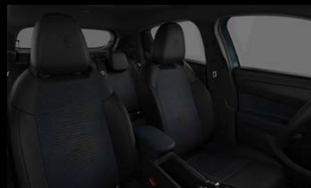
Sedadla Icona v černomodré látce se znakem Biscione (Junior 033)