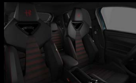
Sedadla Sabelt Corsa v kombinaci techno kůže a Alcantary (Speciale 878 a Veloce 824)