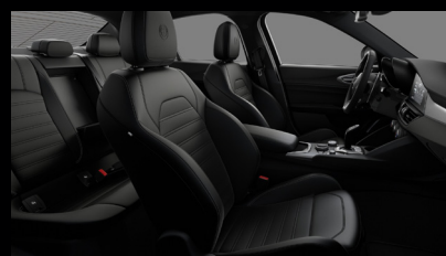
Sportovní perforovaná sedadla v černé kůži (Sprint a Veloce 473)