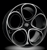
19" disky z lehkých slitin Lusso (Sprint a Veloce 3CX)