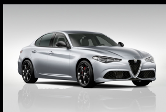
Šedá Moonlight Pearl (61Q-252)