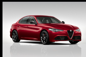
Červená Alfa (5CA-414)