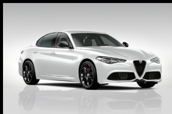
Bílá Alfa (2H6-240)