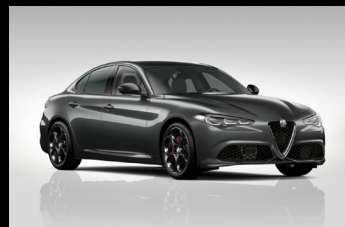
Šedá Vesuvio (5CE-035)