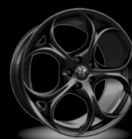
19" disky z lehkých slitin Classico (Tributo Italiano 3CV)