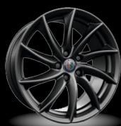
18" disky z lehkých slitin Turbine (Sprint 3Co)