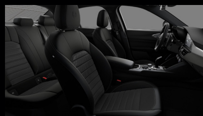
Komfortní sedadla v černé látce (Sprint 030)