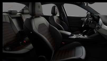
Sportovní perforovaná sedadla v černé kůži s červeným prošíváním a podkresem (Tributo Italiano 646)