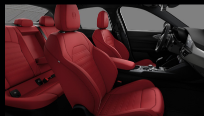
Sportovní perforovaná sedadla v červené kůži (Sprint a Veloce 557)